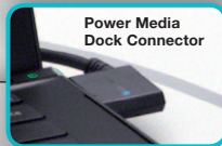
Power Media Dock Connector