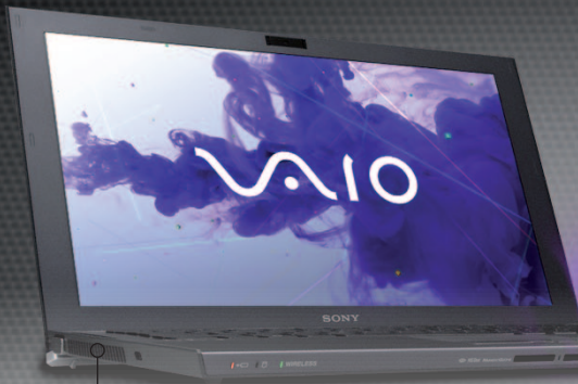
VAIO Z-Serie (Seitenansicht von links)